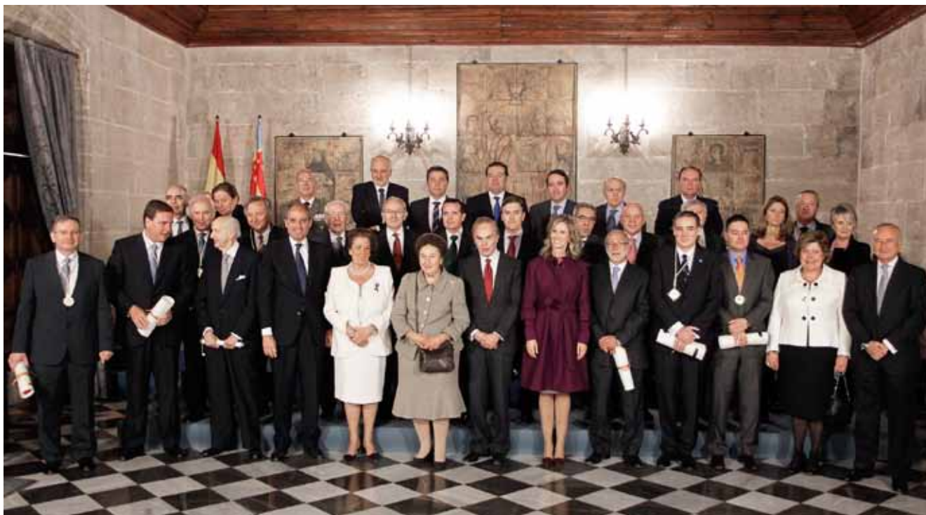
Acto de entrega de los Premios Rey Jaime I

Avanzados, bajo el patronazgo del Rey Juan Carlos, en 1989 con el objetivo de estimular y reconocer la investigación y la ciencia.