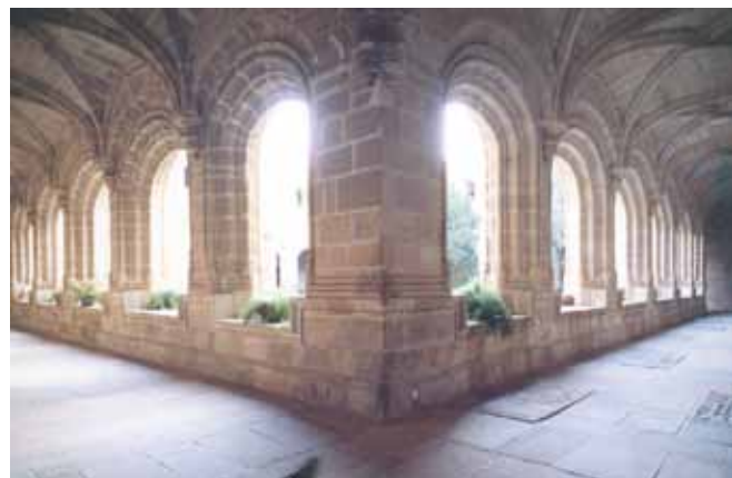
Convento de San Benito de Alcántara