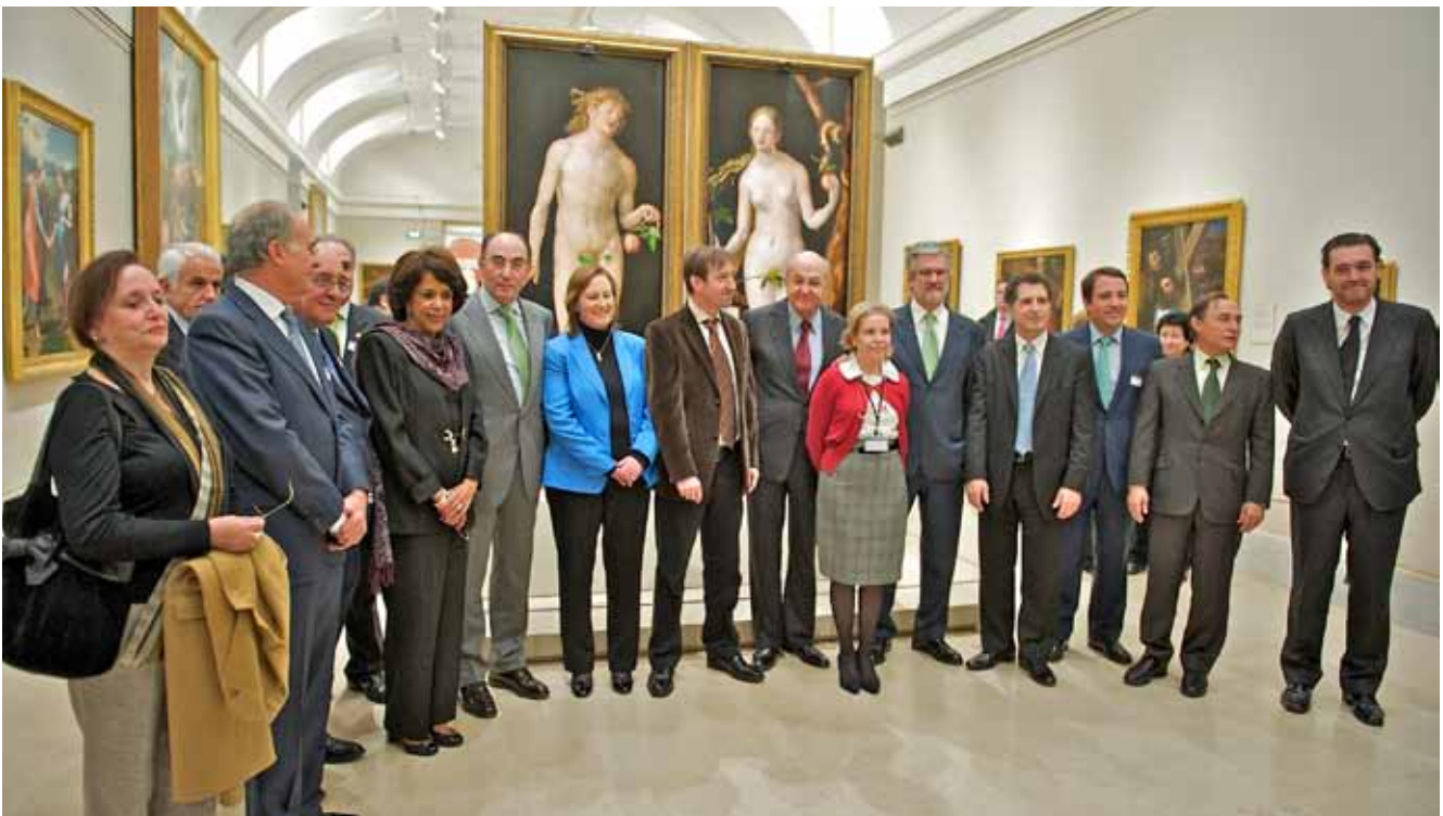
Museo del Prado Presentación de Las Tablas de Durero

Tras la firma del acuerdo, tuvo lugar la presentación de las tablas Adán y Eva (1507) de Alberto Durero (1471 – 1528) a través de una instalación especial en sala de las mismas, primer proyecto realizado con el apoyo de la Fundación IBERDROLA. Ambas obras fueron exhibidas al público durante cuatro meses con un montaje especialmente