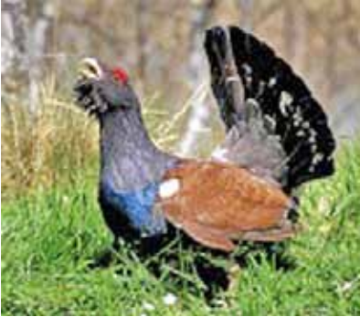
Apoyo a la Biodiversidad Urogallo Cantábrico, subespecie en peligro de extinción

Entre los avances logrados en 2010, hay que destacar que el pasado 11 de junio la Unión Europea comunicó la aprobación de los fondos LIFE+ para el proyecto de forma que contará con un presupuesto total de 7,3 millones de euros, de los que la Unión Europea aporta el 50%. La aprobación de los fondos LIFE+ supone un importante empuje al proyecto, no solo para su continuación, sino para la ampliación de las iniciativas puestas en marcha en el Parque Nacional de Picos de Europa: