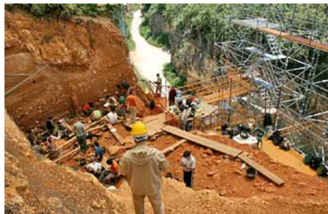
Atapuerca Excavaciones en el yacimiento arqueológico

Este acuerdo de colaboración tiene como fines la promoción y desarrollo del Museo Etnográfico de Talavera en su misión de adquirir, conservar, investigar, comunicar y exhibir todos aquellos materiales etnográficos, etnológicos y antropológicos de Talavera y su comarca.