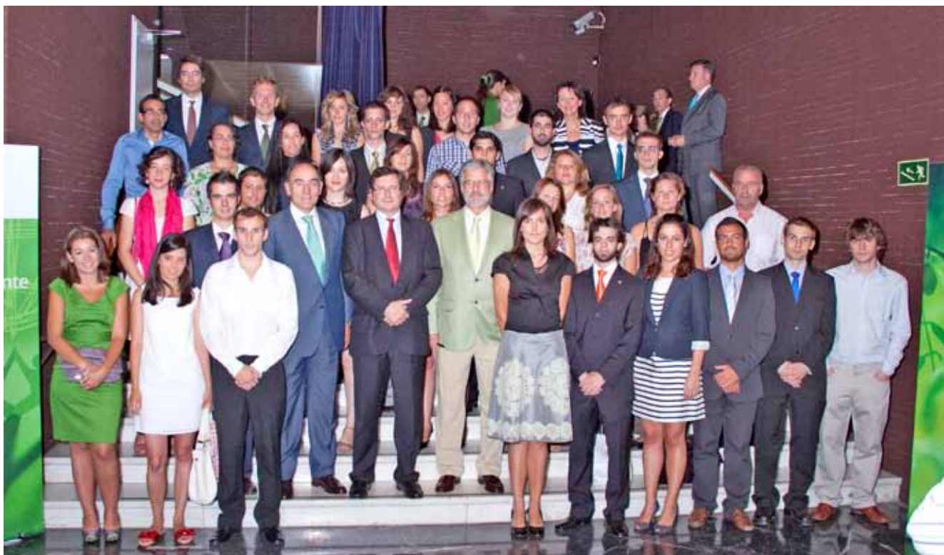
Acto de entrega de becas en Casa de América Fotografía de familia

Durante el ejercicio 2010 la Fundación IBERDROLA ha lanzado la primera Convocatoria del Programa de Becas de Energía y Medio Ambiente para el curso académico 2010-2011. En esta convocatoria se han concedido 38 becas para estudios de postgrado en España y en Reino Unido, en las siguientes áreas de conocimiento e investigación: