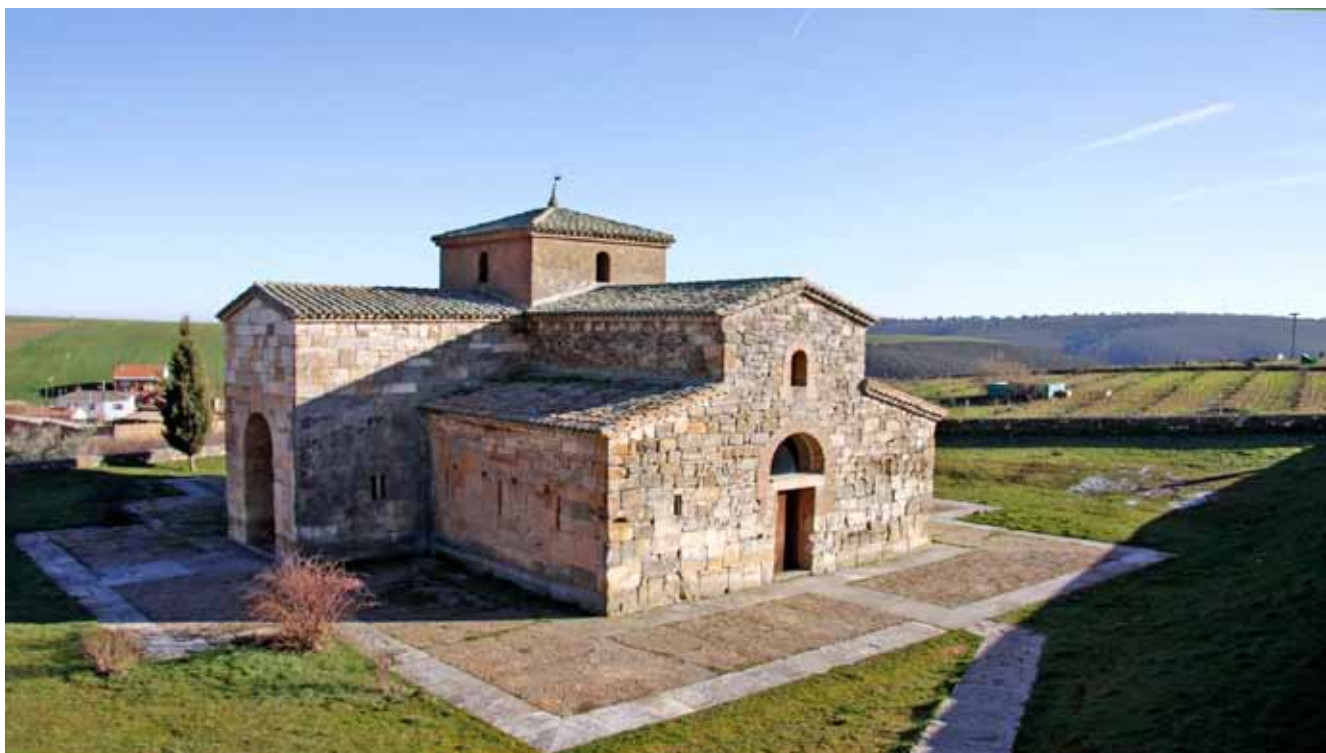
Plan de Restauración del Románico Atlántico Iglesia de San Pedro de La Nave en Campillo (Zamora)