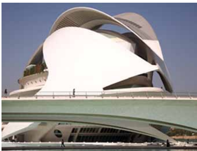
Palau de les Arts Reina Sofia

La Fundación IBERDROLA patrocina las actividades y la programación artística desarrollada por el Palau de les Arts, cuyo majestuoso edificio diseñado por el arquitecto valenciano Santiago Calatrava se presenta como una gran escultura de alto contenido simbólico. La Orquestra de la Comunitat Valenciana, titular del Palau de les Arts Reina Sofia, está integrada por músicos internacionales personalmente seleccionados por su director musical, Lorin Maazel, quien lidera la formación desde su fundación en 2006. En poco tiempo, la OCV, galvanizada por Maazel, se ha situado entre los conjuntos más ascendentes del panorama internacional, y ha sido elogiada por público y crítica como "una de las mejores orquestas surgidas en los últimos años".