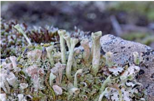
Parque Nacional de Monfragüe Cladonia, una de las 95 especies de líquenes catalogadas

Esta iniciativa está alineada con los programas de conservación del urogallo que ScottishPower, empresa del Grupo IBERDROLA, lleva a cabo en Reino Unido, en concreto, el programa trianual "Friends of the Capercaillie", en el que participa junto a la Royal Society for the Protection of Birds. Este proyecto tiene como objetivo enriquecer los bosques que sirven como hábitat de los urogallos en la Reserva de Abernethy en Escocia.